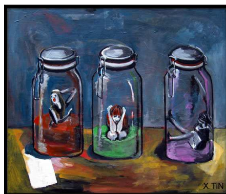
La collection 50cm x 60cm