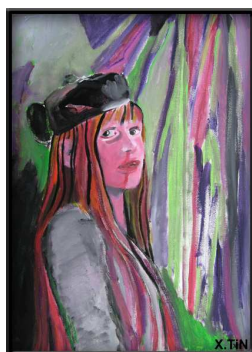
regard de chienne battue 46x33cm