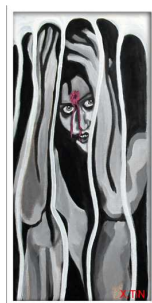
à la tête